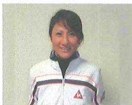
高野みえ子プロ(日本女子プロゴルフ協会ツアープロ)